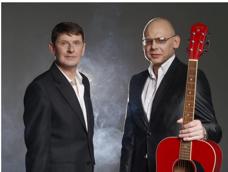
Grupa “Tērvete”

Plkst. 23:00 svinības turpināsies Simtgades Zaļumballē Jaunpils parka estrādē, kurā spēlēs grupa “Tērvete”, darbosies kafejnīca un būs arī citas izklaides.